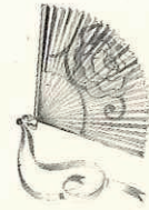
MME ZSA ZSA